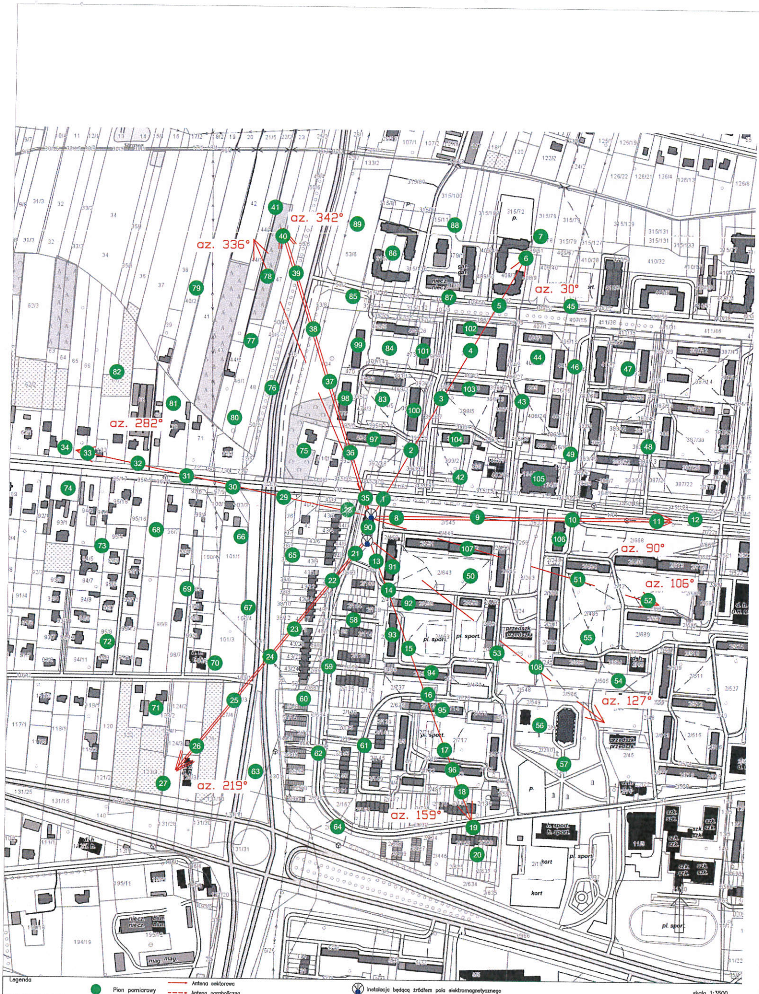
Rys.1 Lokalizacja pionów pomiarowych

Legenda Pion pomiarowy Antena sektorowa Antena paraboliczna Instalacja będąca źródłem pola elektromagnetycznego skala 1:3500