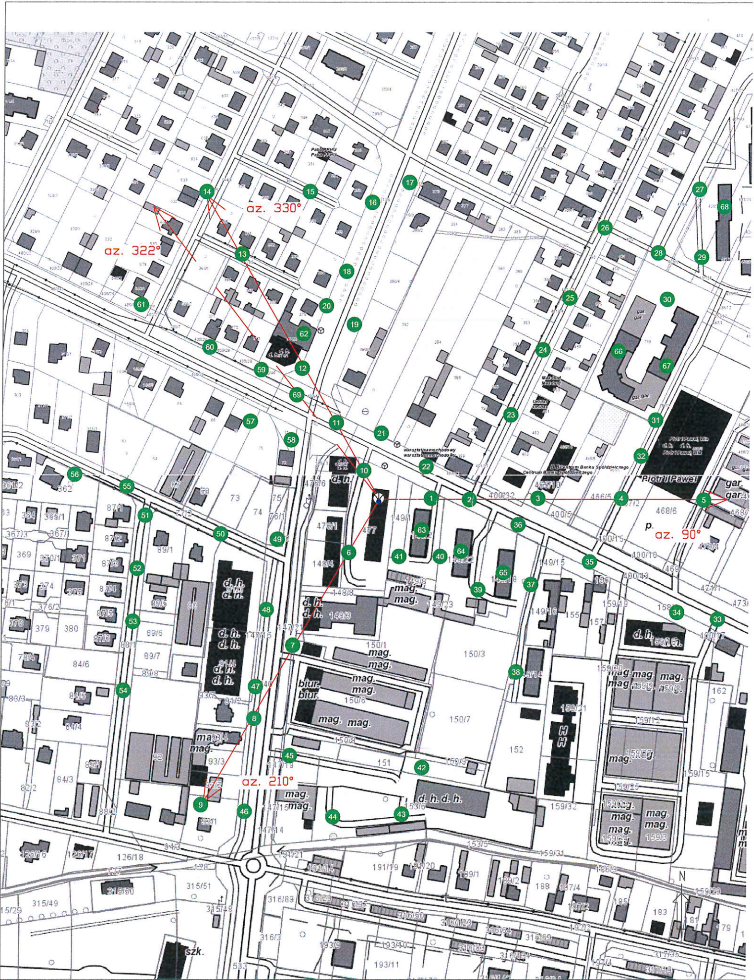
Rys.1 Lokalizacja pionów pomiarowych